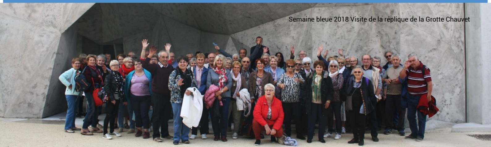
Semaine bleue 2018 Visite de la réplique de la Grotte Chauvet

Les mairies du territoire de la Communauté de Communes du Royans Vercors, Coordination Autonomie Prévention Conseil Départemental de la Drôme.