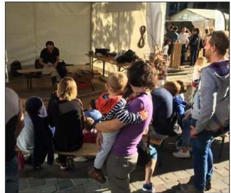
Les familles ont assisté à une démonstration de taillage de silex tout en s'informant sur la préhistoire.

De quoi donner envie aux Parisiens d'aller visiter le musée de la préhistoire de Vassieux, classé Monument historique puis labellisé Musée de France.