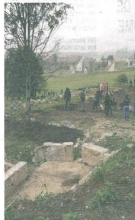
Des élèves de l'école des Mines de Saint-Étienne sont venus prêter main-forte aux bénévoles de l'association Vespa.