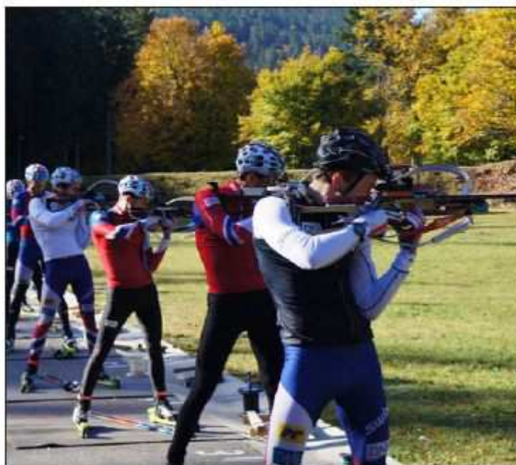
L'équipe de Norvège de biathlon en préparation.