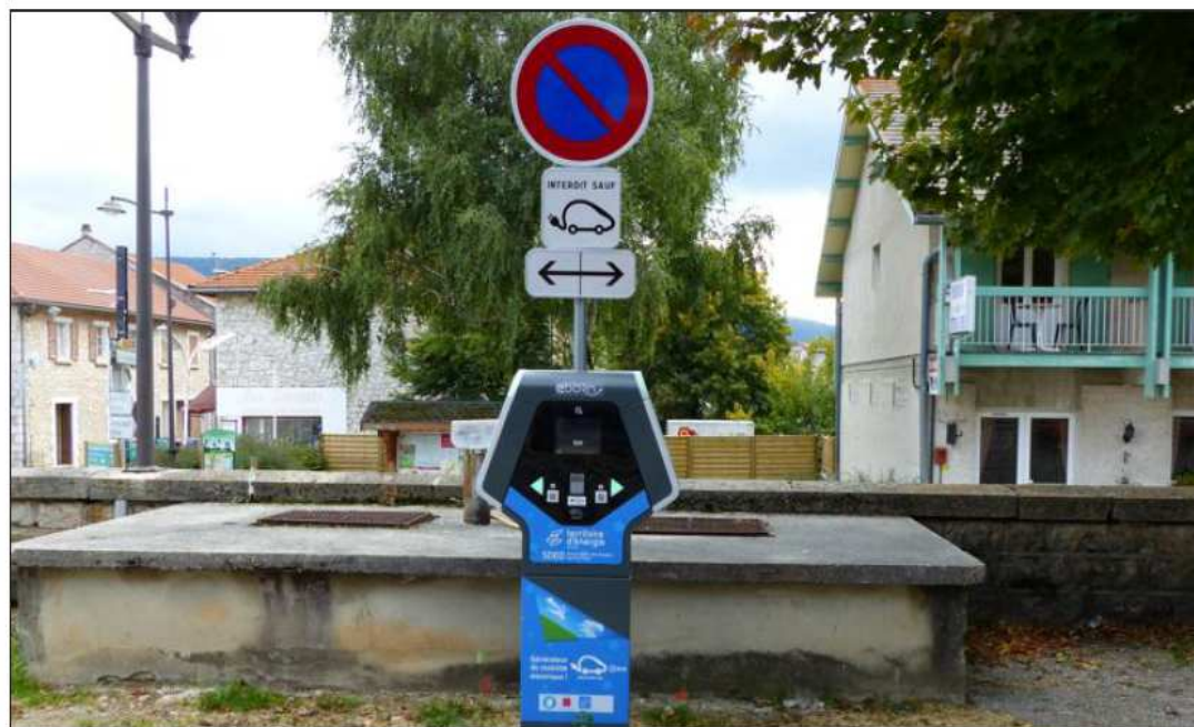
La première borne permet de recharger les véhicules électriques.

La solution semble avoir été trouvée avec l'installation de cette borne. Dorénavant, il en coûtera pour les camping-caristes 2 € pour 100 litres d'eau et 2 € pour 20 minutes de charge électrique.