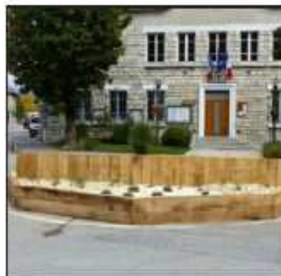
Le nouveau rond-point au centre du village.

Avec le temps et les conditions météorologiques particulièrement difficiles en hiver, les différents éléments de l'ancien rond-point s'étaient dégradés. Le conseil municipal a donc décidé sa rénovation, calculée au plus juste compte tenu de la situation financière délicate de Vassieux-en-Vercors évoquée à plu-