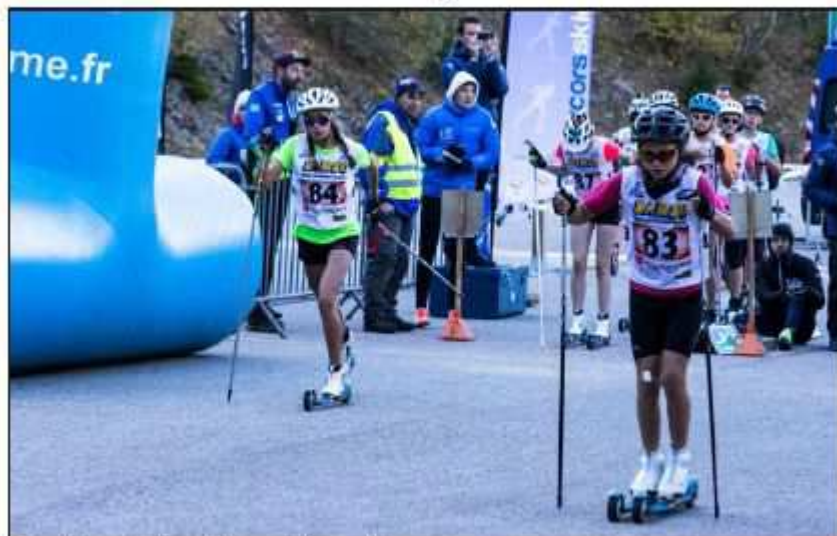
Des minimes ont pris part à la compétition en ski-roues.